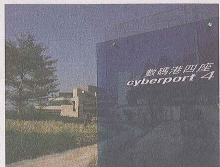
位於數碼港的新校園佔地四萬平方呎，整個新校園糅合尖端科技，讓學員能在最優良的環境下學習。

教學大樓設計方面，新校園糅合尖端科技：全棟教學大樓均安裝了Wi-Fi無線上網系統，讓學員及教職員隨時隨地可以上網。教室及會議室等配備了視像會議設備、先進的影音器材、巨型等離子顯示屏、高效能隔音設施及無線電腦投影等設備，其設備之尖端，白教授笑謂，任何一位學員，只要在他的手提電腦上輕按一個按鈕，其電腦上的影像便會即時投放在課堂內的牆壁上，讓其他學員同一時間看到。這一切先進的科技，昔日在香港的院校從未用上，能有助提升學員的學習效率。